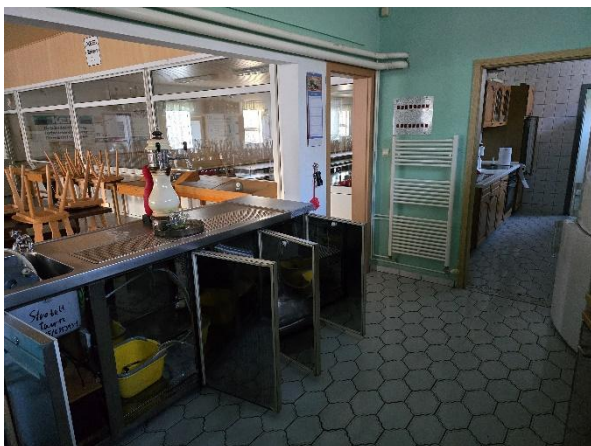
Theke mit Blick zur Kegelbahn und Küche