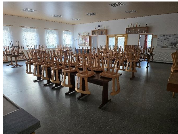
Saal mit Blick zu den Umkleiden und Eingangsbereich