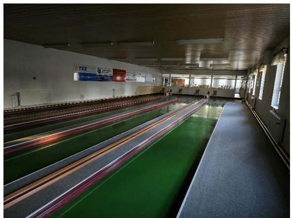
Kegelsportanlage mit Blick zum Saal