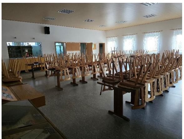
Saal mit Blick zur Theke und Toiletten